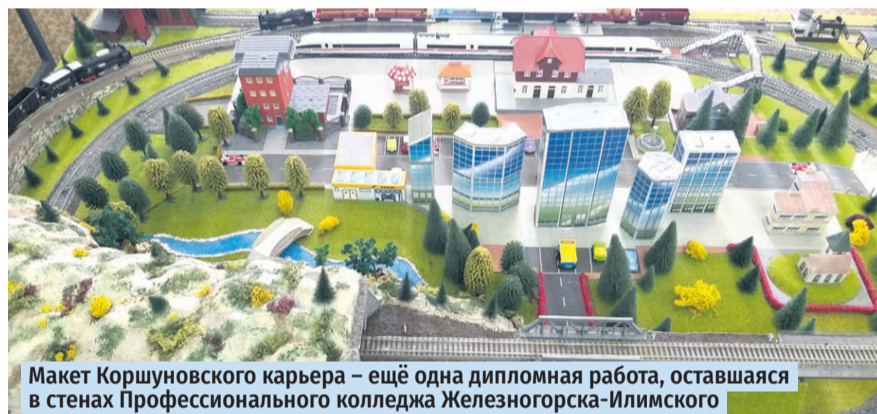
Макет Коршунского карьера — ещё одна дипломная работа, оставшаяся в стенах Профессионального колледжа Железнодорожника-Илимского