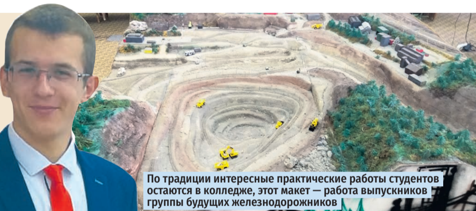
По традиции интересные практические работы студентов остаются в колледже, этот макет — работа выпускников группы будущих железнодорожников